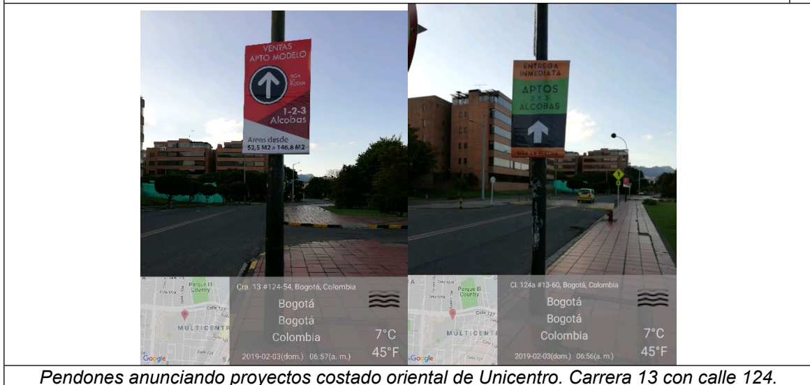
Pendones anunciando proyectos costado oriental de Unicentro. Carrera 13 con calle 124.