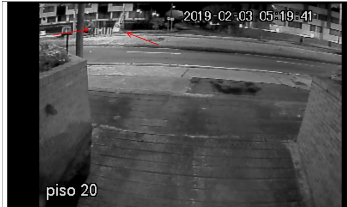
Primera persona ubica escalera en otro poste, la segunda (conductor del camión) ayuda a extender y alcanzar las sogas para proceder al amarre del pasacalle.