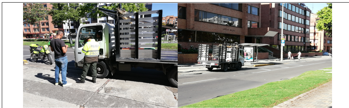
Identificación de los responsables de la colocación de publicidad.

Teniendo en cuenta lo anterior y la actividad que se encontraban realizando los sujetos del camión, se procedió por parte de la comisión a solicitar apoyo de la autoridad policiva para poder proceder a la plena identificación de las personas que se encontraron colocando publicidad en espacio público.