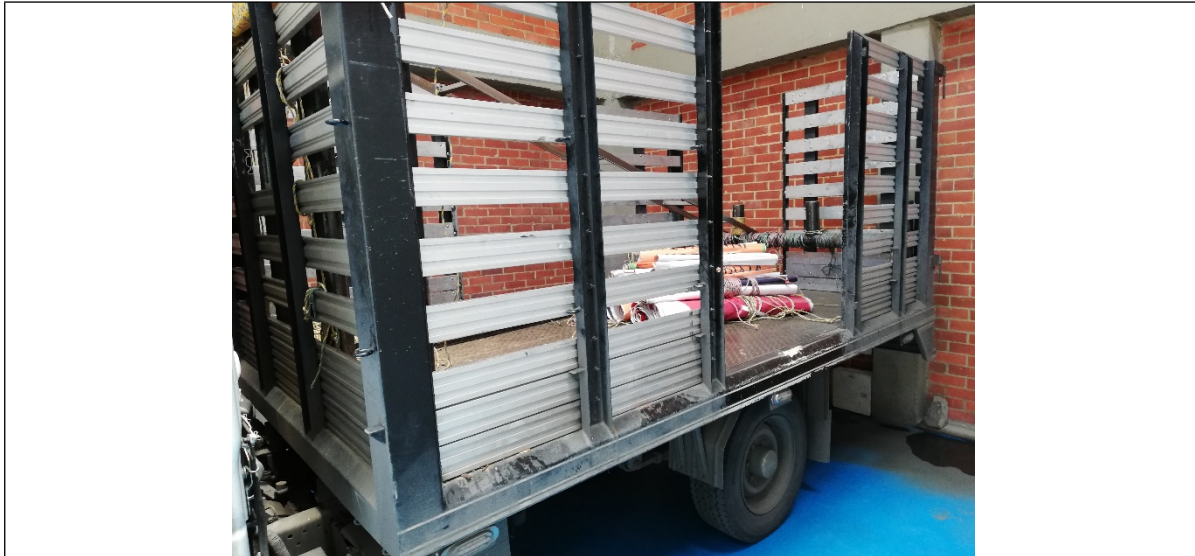
Escaleras y sogas utilizadas como medios e implementos para la colocación de publicidad exterior visual.