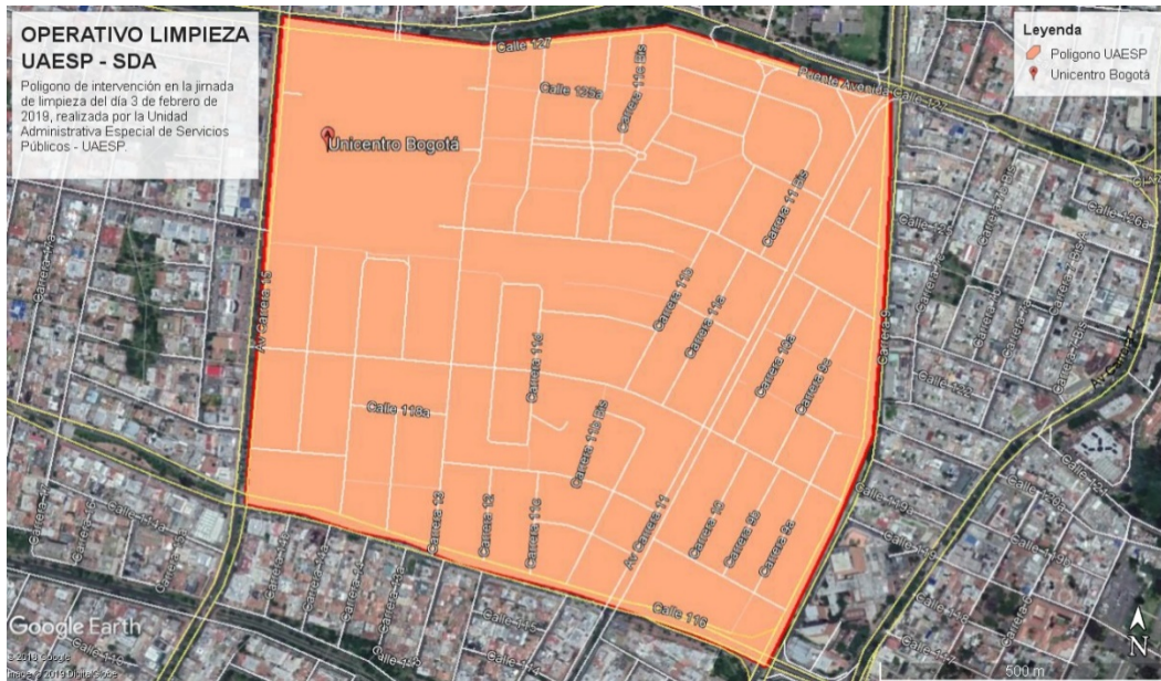
Imagen 1. Polígono de intervención de recorrido de limpieza de publicidad realizada por la UAESP en acompañamiento con la SDA, comprendido entre las Calles 127 y 116 y las Carreras 15 y 9.

Durante el recorrido realizado por los contratistas de las entidades del Distrito, se logró evidenciar en diferentes puntos la colocación de pendones y pasacalles que dentro de su publicidad anuncian la venta de apartamentos de proyectos de construcción ubicados al parecer dentro del polígono antes referenciado. Entre los puntos que se encontró publicidad en el espacio público se registra, entre otros los siguientes: