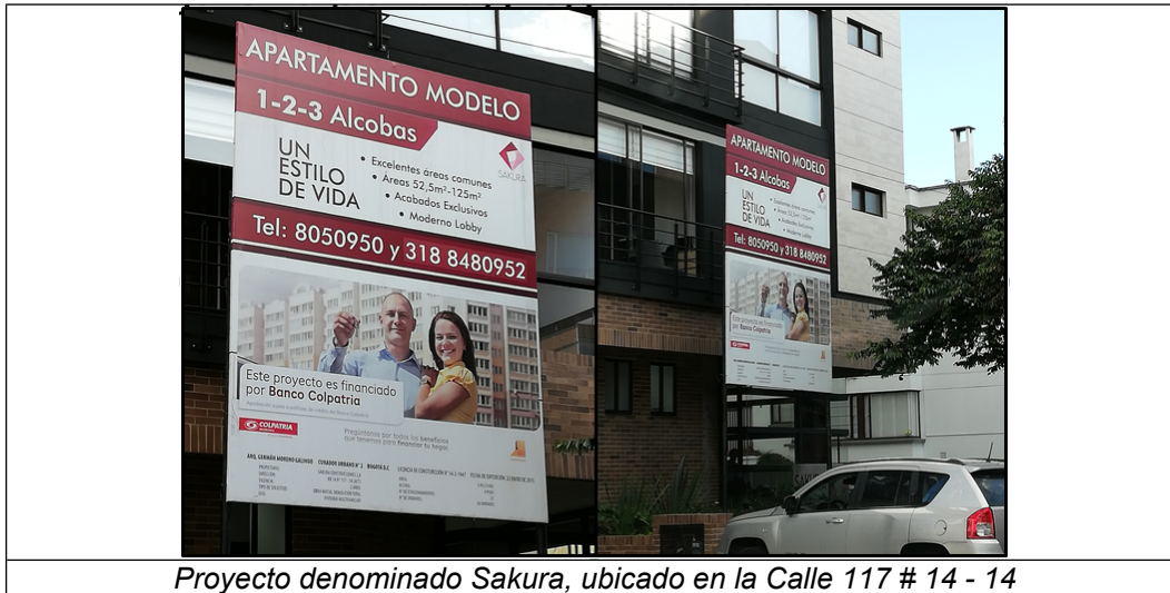
Proyecto denominado Sakura, ubicado en la Calle 117 # 14 - 14

ALCALDÍA MAYOR DE BOGOTÁ D.C. SECRETARÍA DE AMBIENTE