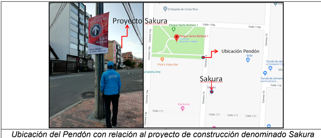
Ubicación del Pendón con relación al proyecto de construcción denominado Sakura

Luego de continuar con el recorrido, aproximándose la comisión al parque denominado Parque Santa Bárbara 1, en la esquina de la carrera 14 con calle 118, se identifica un pendón colocado en poste, el cual dentro de su imagen aparece una flecha señalando hacia un sentido, que como se aprecia en las siguientes imágenes, el cual probablemente pertenece al proyecto denominado SAKURA.