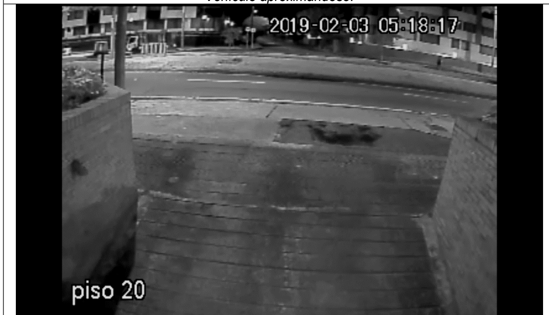
Vehículo estacionado en vía pública