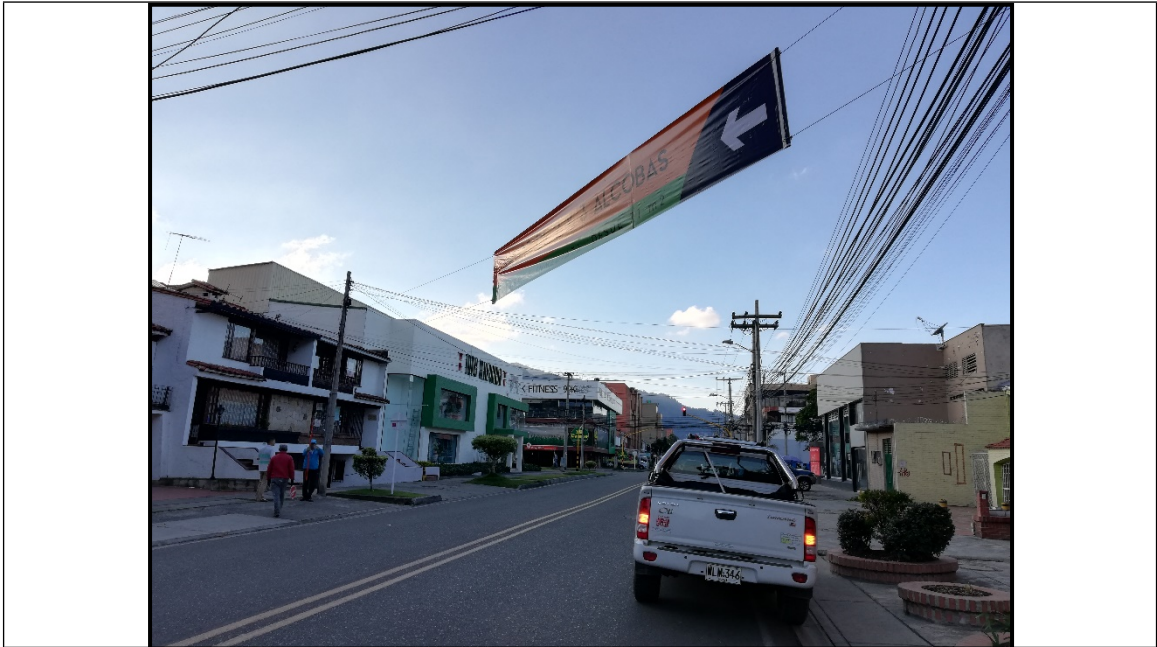
Pasacalle en espacio público anunciando venta de proyecto de construcción, en inmediaciones de la Carrera 13 # 119 – 39.

ALCALDÍA MAYOR DE BOGOTÁ D.C. SECRETARÍA DE AMBIENTE