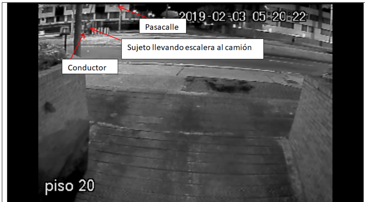
Actividad de colocar publicidad en espacio público finalizada. Se observan a la primera persona cargar la escalera, y dirigirse hacia el camión.

Teniendo en cuenta las imágenes anteriores se logra determinar que los sujetos se encontraban colocando elementos de publicidad exterior visual tipo pendones y pasacalles, utilizando como medio el camión, escalera, sogas.