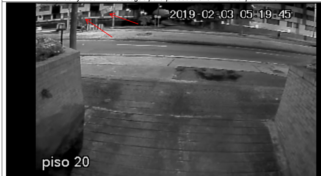
Se puede observar el pasacalle completamente extendido, mientras la persona en la escalera termina de amarrar el elemento al poste.