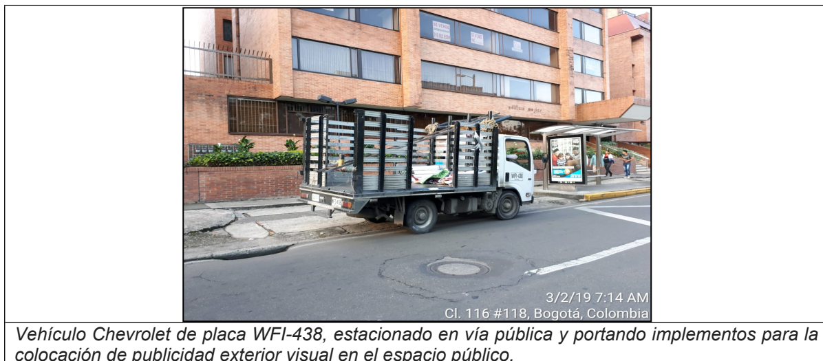
Vehículo Chevrolet de placa WFI-438, estacionado en vía pública y portando implementos para la colocación de publicidad exterior visual en el espacio público.

Adicionalmente se logra establecer que las referidas personas habían colocado publicidad exterior visual esa mañana, en las áreas que constituyen espacio público, como postes de redes telefónicas y de eléctricas, como se observa en la siguiente secuencia de imágenes obtenidas de la cámara de seguridad del EDIFICIO VENUS, ubicado en la Calle 116 # 11A - 51.